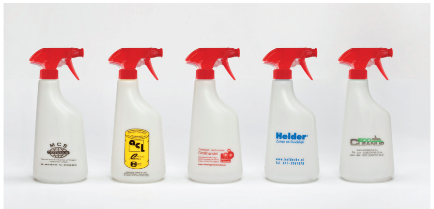
Tex-Foam Sprühkopfe mit Flaschen 600 ml