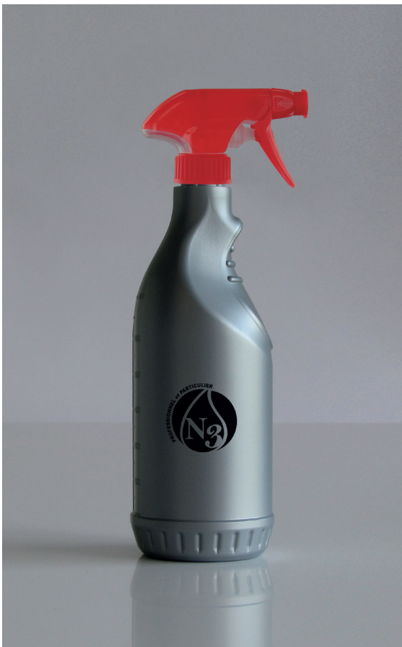
Tex-Foam Sprühkopfe mit Flasche 750 ml