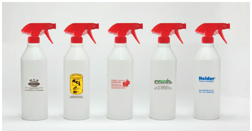
Tex-Foam Sprühkopfe mit Flaschen 1000 ml