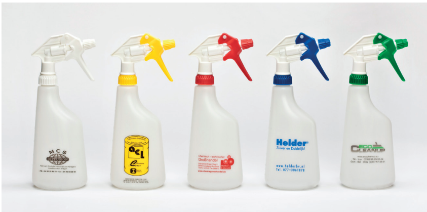
Tex-Spray Sprühköpfe mit Flaschen 600 ml

Flaschen 600 ml: 560 Stück, Flaschen 1000 ml: 3000 Stück