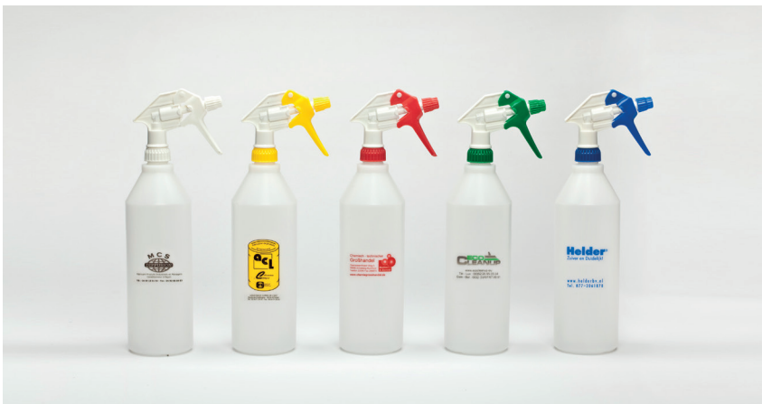
Tex-Spray Sprühköpfe mit Flaschen 1000 ml