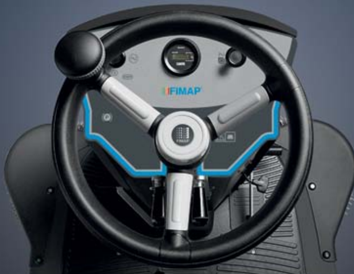
Instrumentenbrett Ausführung H Basic

Die Bürstenbewegungen (Mittel- und Seitenbürste) lassen sich einfach über 2 Hebel steuern