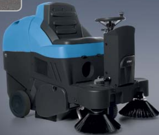
FS700 B (Basic)