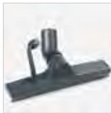
Wand- und Fensterdüse