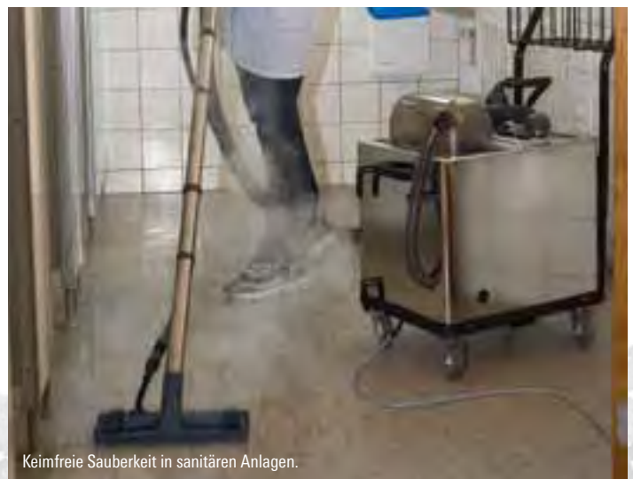
Keimfreie Sauberkeit in sanitären Anlagen.