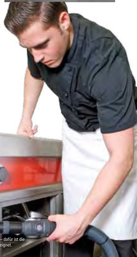
Abluftfilter sind schwierig zu reinigen – dafür ist die Dampfstrahldüse gebogen bestens geeignet.