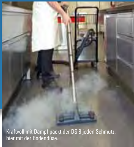
Kraftvoll mit Dampf packt der DS 8 jeden Schmutz, hier mit der Bodendüse.