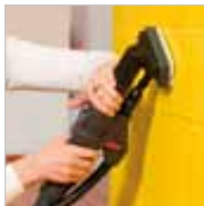
Die Wanddüse schmal reinigt auch poröse Flächen, für kleine Flächen geeignet.