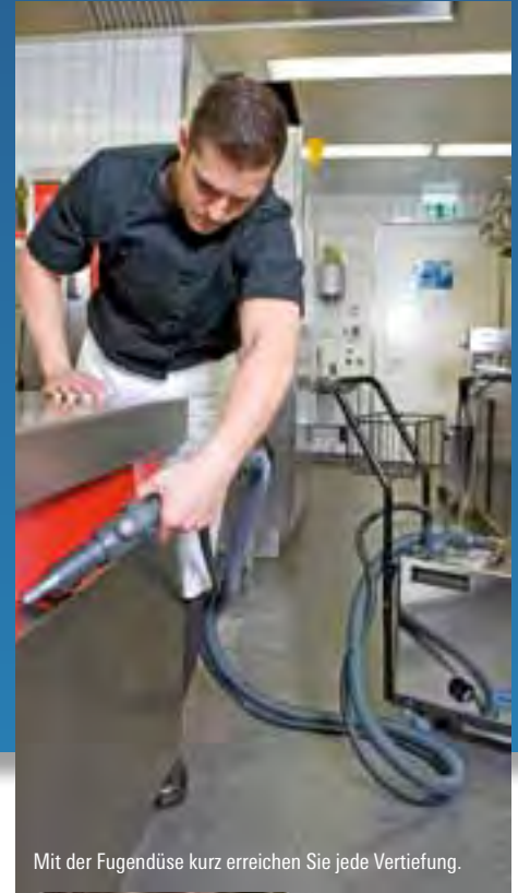
Mit der Fugendüse kurz erreichen Sie jede Vertiefung.