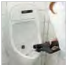
Mit der Dampfstrahldüse gebogen erreichen Sie jede Verschmutzung.