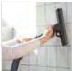
Mit der Wand- und Fensterdüse erstrahlen Fliesen im neuen Glanz – wie neu.