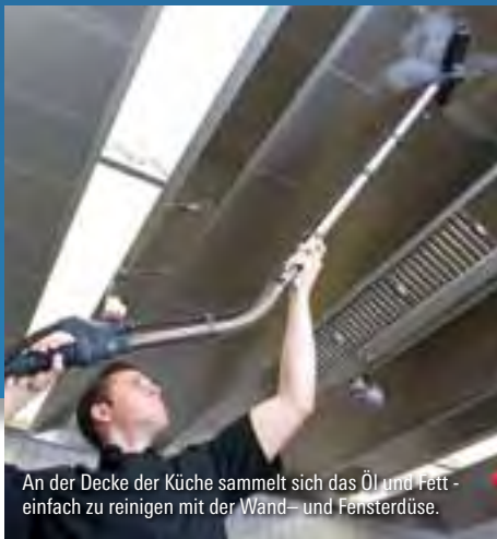
An der Decke der Küche sammelt sich das Öl und Fett - einfach zu reinigen mit der Wand- und Fensterdüse.

Auch für Lebensmittelindustrie, Schwimmbäder, Wellnessbereiche und Sportanlagen unentbehrlich.