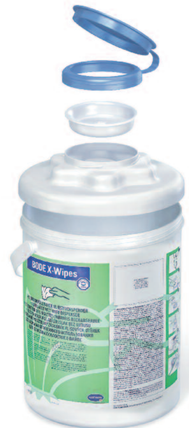
3-teiliges Deckelsystem sowie Spendergehäuse für einfache und sichere Aufbereitung