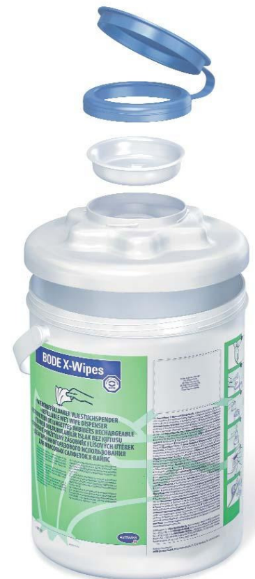
3-teiliges Deckelsystem sowie Spendergehäuse für einfache und sichere Aufbereitung