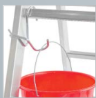
Eimerhaken für Sprossenleitern