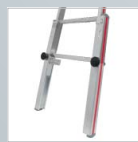
Fußverlängerungsset für Sprossenstehleitern