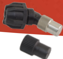
Regulierbare Düse 1.3 mm Art.Nr. 11908801