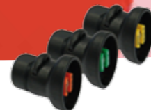
Flachstrahldüsen* Art.Nr. 11612801-SB – 11612808-SB