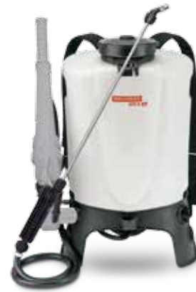
RPD 15 PB1 Art.Nr. 11952501