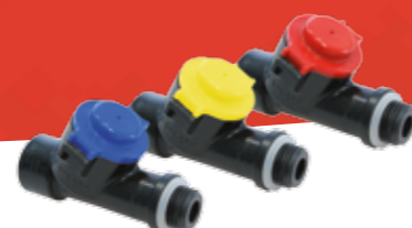
Druckreguliertventile* Art.Nr. 11698401-SB – 11698403-SB

*Benötigt Sprührohr 50 cm gebogen, einseitig geschraubt Art.Nr. 11430803