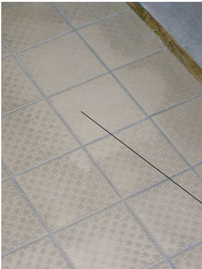
Abb. Entkrustung der Ränder ( EKF )