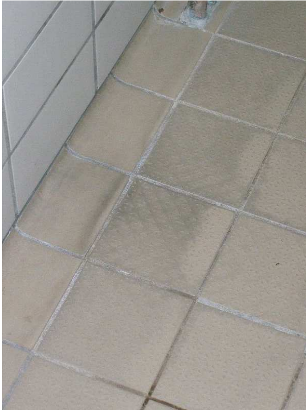
Abb. Schwarze Randbereiche , Kalkseifen