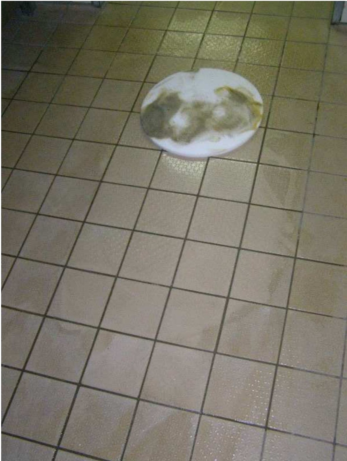
Abb. Einsatz der Melaminschwämme und Melamin- Padtechnik