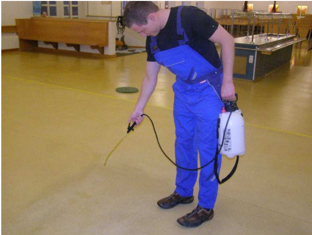
Abb. Grundreinigung mit Solex im Sprühverfahren