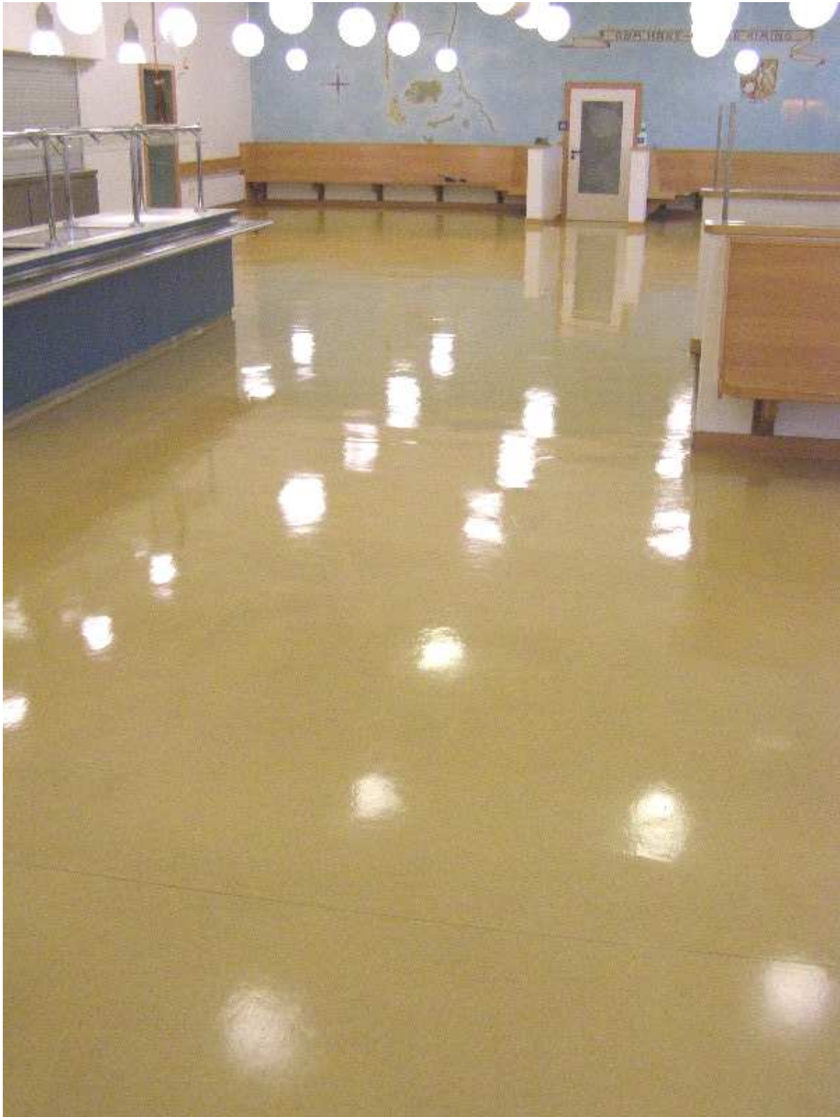
Abb. Endoptik nach 2 Tagen Grundreinigung und vier Schichten TRIGOMAT