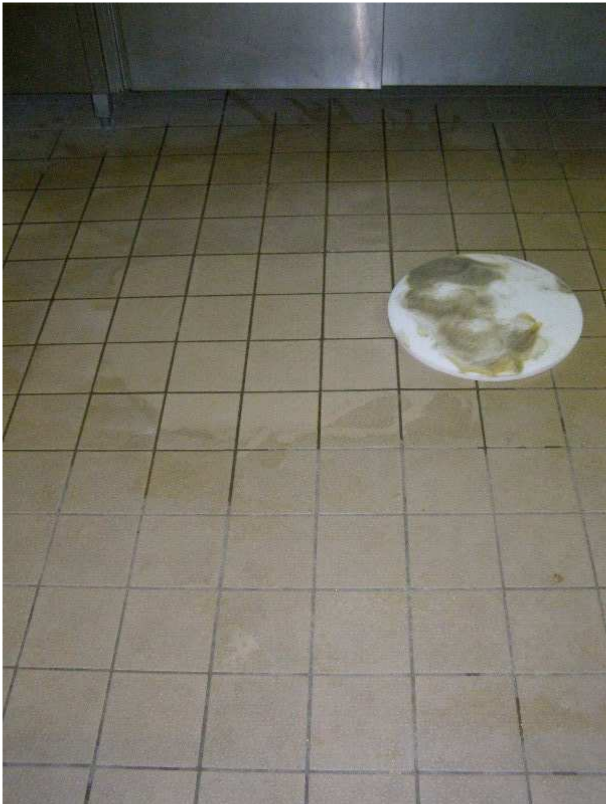
Abb. Testreinigung mit Picomat FS + GR extra , die Herrn Walz überzeugte .