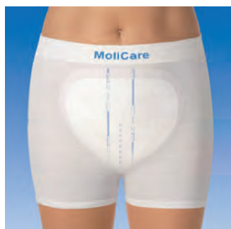
Zur sicheren und problemlosen Fixierung von Inkontinenzvorlagen.

Die hochelastischen Netzhöschchen für Inkontinenzvorlagen.