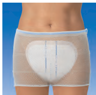
Elastische Netzhöschchen zur Fixierung von Inkontinenzvorlagen.

Die hochelastischen Netzhöschchen für Inkontinenzvorlagen.