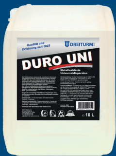
DURO UNI Universalpflege-Beschichtung