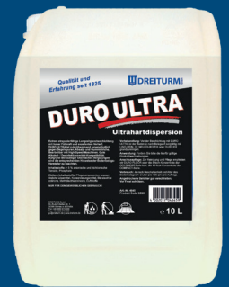
DURO ULTRA Langzeitbeschichtung