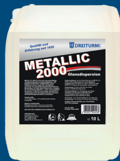
METALLIC 2000 Glanzdispersion