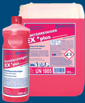
SANITÄRREINIGER EX+plus Sanitär-/Schwimmbadreiniger

10+1* 1 VPE ** gratis bei Abnahme von 10 Sorten- reinen VPE