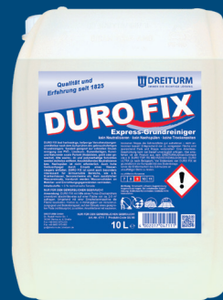
DURO FIX Express-Grundreiniger