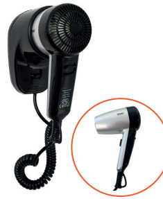
Ref. 01064 Finish: Silver and black Finition: Argent et noir Power: 1.200 W Puissance: 1.200 W