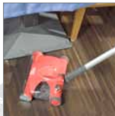
Überall wo's eng wird ist der FlooBe gerade richtig