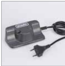
067.011 Schnell-Ladegerät für Akku