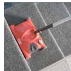
Für Sockelreinigung Visier abnehmen – so ist randnahes Reinigen auch auf der Treppe möglich