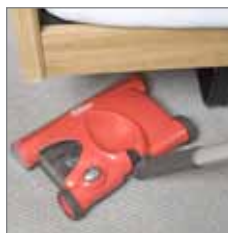
Mit dem FlooBe kommen Sie überall hin, auch unter Betten