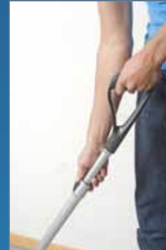
Teleskoprohr auf jede Personengröße einstellbar

Besonders geliebt wird der FlooBe in Restaurants, Schulen, Büros, Hotels und überall, wo stets die Sauberkeit regiert. Etwas verschüttet? Was man früher mühsam mit Besen und Kehrschaufel im Bücken aufnahm, erledigt heute elegant der FlooBe. Mit Leichtigkeit schafft er sogar die Aufnahme von Tierhaaren. Der Griff und der Schmutzbehälter sind antibakteriell beschichtet, was die keimfreie Hygiene unterstützt. Der FlooBe ist die ideale Ergänzung für jeden Systemwagen.