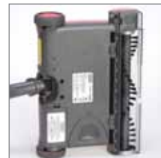
Untersicht mit Akkufach und Aufladekontakt