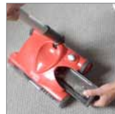
Einfaches Leeren des Schmutzbehälters