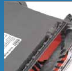
Kraftvolle Walzenbürste für optimale Schmutzaufnahme