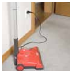
FlooBe auf die Ladestation stellen, einstecken. In ca. 8 h wieder voll aufgeladen