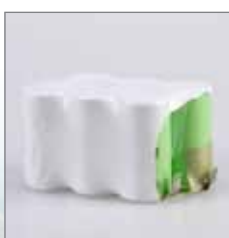
067.010 Akkupack 7.2 Volt