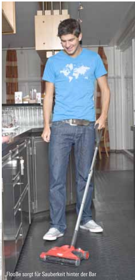
FlooBe sorgt für Sauberkeit hinter der Bar