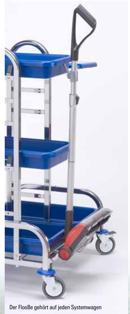
Der FlooBe gehört auf jeden Systemwagen