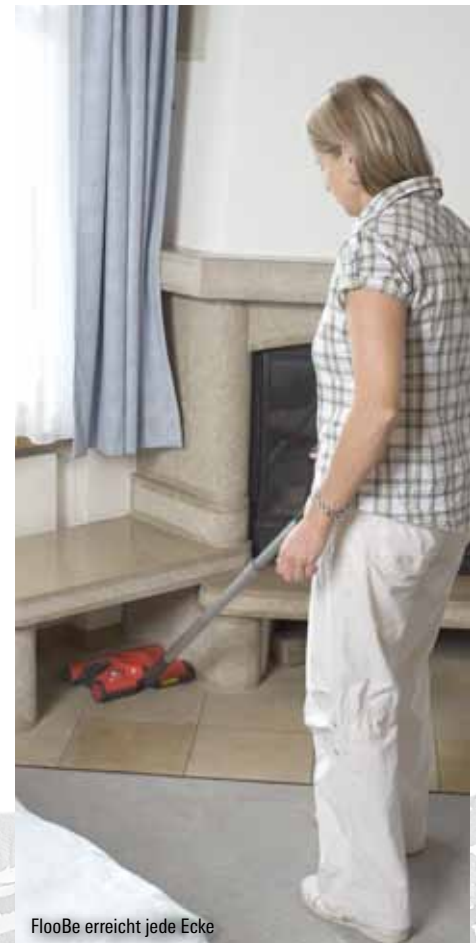
FlooBe erreicht jede Ecke