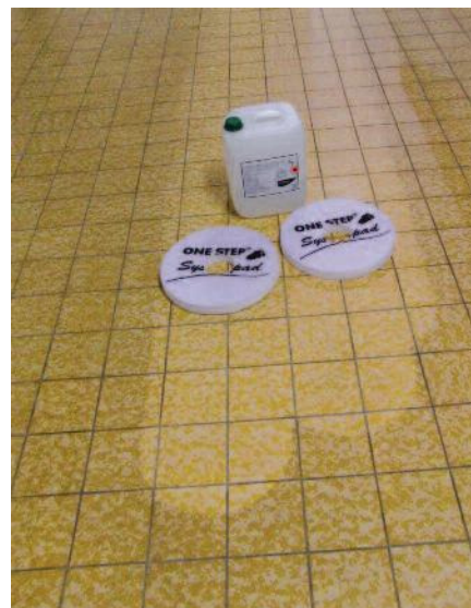
Das neue Pad von Dr. Rauwald Reinigungssysteme für die Grund- und Unterhaltsreinigung