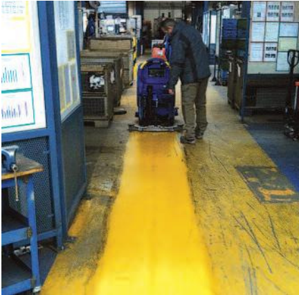
Nach nur einem Reinigungsgang mit dem Pad sieht man schon ein deutliches Ergebnis

Ein Weg um Grundreinigungen zu vermeiden schien mit der Einführung der Melamin-Pads möglich geworden zu sein. Diese zeigen ganz hervorragende Reinigungseigenschaften auf allen Hartböden und sind besonders für Fein-steinzeug, Terrakotta und Betonwerkstein geeignet.