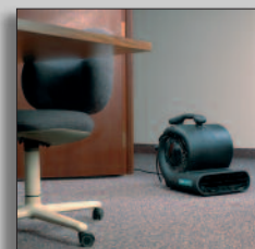
Maschine im Einsatz