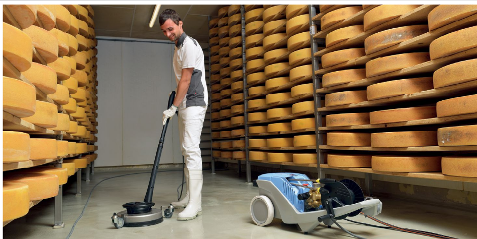
Abb. Non-Marking-Ausführung (NoM). Info Seite 58