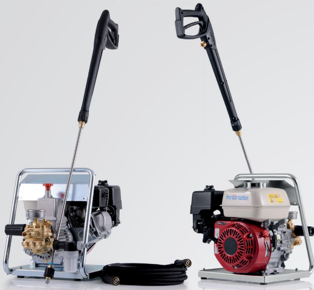
Profi-Jet B 13/150