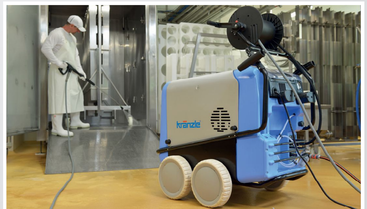
Abb. Non-Marking Ausführung (NoM). Info Seite 58

Detaillierte technische Angaben auf Seite 87