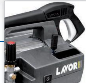
Mit Ansaugsystem für Reinigungsmittel