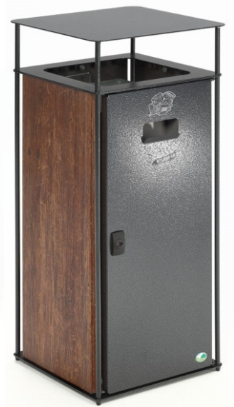
Abb.: Art.-Nr. 21285