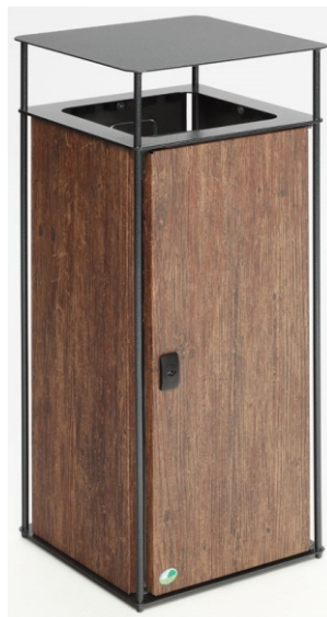
Abb.: Art.-Nr. 21284