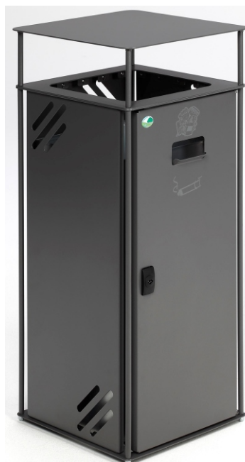
Abb.: Art.-Nr. 21282

(PVC-Folie: Beständigkeit gegen Wasser, Schmutz, UV-Strahlen und Verschleiß)