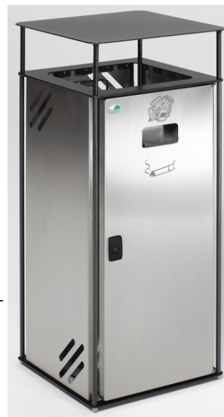
Abb.: Art.-Nr. 21283