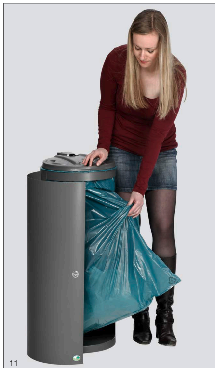
Abb.: Art.-Nr. 28740