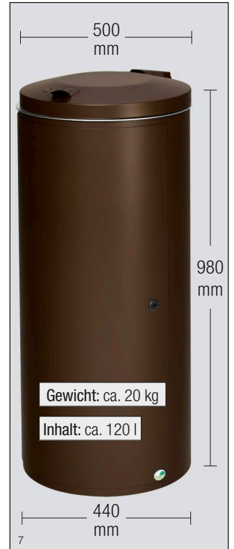
Abb.: Art.-Nr. 28746