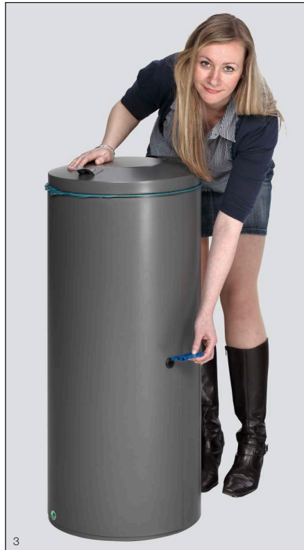
Abb.: Art.-Nr. 28745