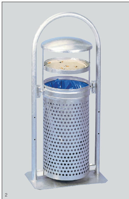
Abb.: Rohrbogenständer RB 002, Art.-Nr. 1879