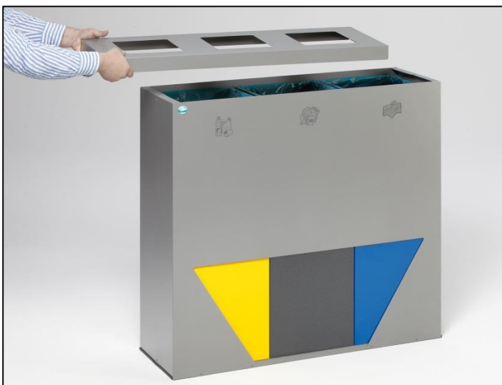
Abb.: Art.-Nr. 21342