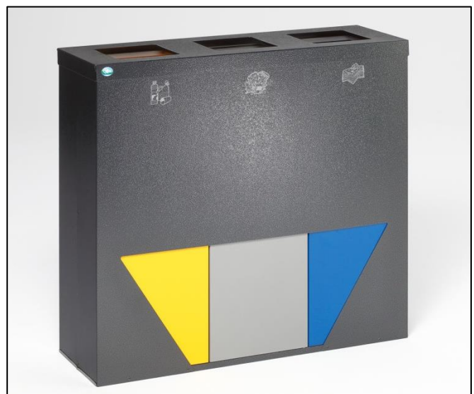
Abb.: Art.-Nr. 21343