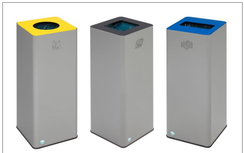
Abb.: Art.-Nr. 21307, 21308, 21309