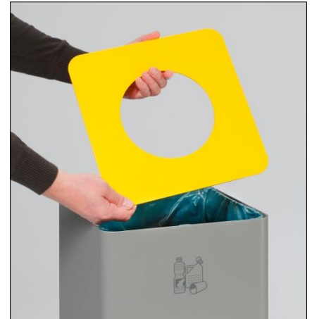
Abb.: Art.-Nr. 21307

Die Entleerung der einzelnen Wertstoffsammler erfolgt über den abnehmbaren Aufsatz. Im Bodenbereich ausgerüstet mit Kantenschutz.