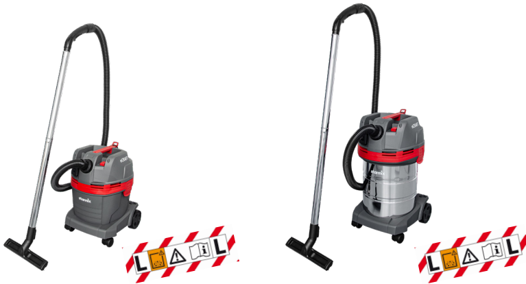
eCRAFT APL-1422 Zum Nass- und Trockensaugen, mit Steckdose für Elektrowerkzeug 22l-Behälter