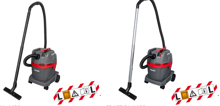
eCRAFT L-1422 Zum Nass- und Trockensaugen 22l-Behälter

Perfekt als Reinigungssauger für zuhause, im Hobbykeller, auf der Baustelle oder in der Werkstatt. Mit universell einsetzbarem Zubehör, auch für den ambitionierten Heimwerker oder für kleine Reparatur- und Montagearbeiten zwischendurch.