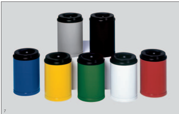
Abb.: Papierkorb 80-l, weiß besch., Art.-Nr. 3175, Papierkorb 50-l, silber besch., Ar.-Nr. 3169, Papierkorb 30-l, schwarz besch., Art.-Nr. 3152, Papierkorb 110-l, gelb besch., Art.-Nr. 3187 und Papierkorb 15-l, rot besch., Art.-Nr. 3140