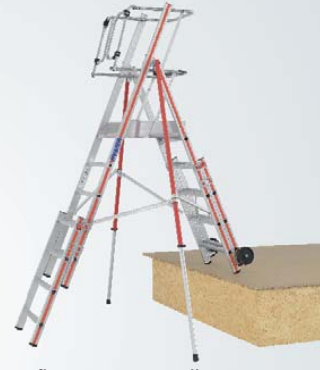
Aufbau in Treppenstellung möglich.