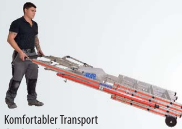
Komfortabler Transport durch Kipprollen.