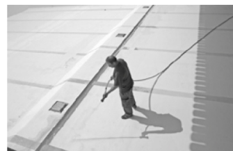
Teich- und Poolreinigung