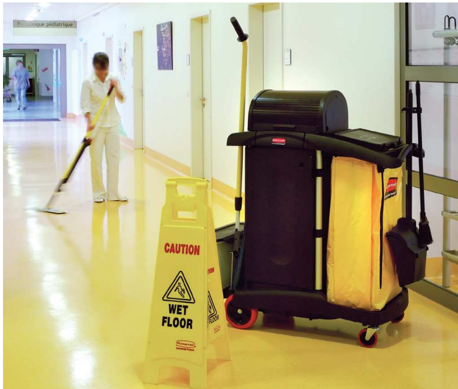
Healthcare Cart 9T75 mit einem Desinfektionseimer Q950 und a Pulse Kit Q969-58