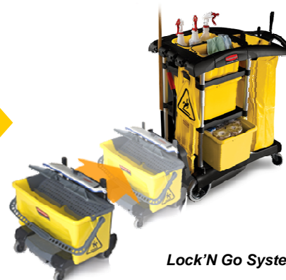
Lock'N Go System