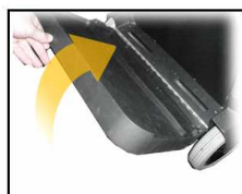
Flip Platform Up