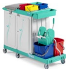
Magic Line 360E