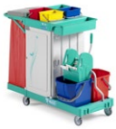
Magic Line 360S