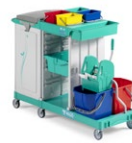
Magic Line 360P