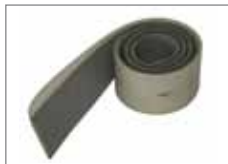
535.082 Abstreiflamellensatz Standard