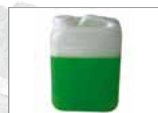
565.535 Kanister 5 Liter leer