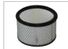
535.440 Filterpatrone Standard