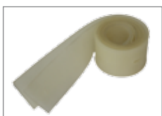
535.081 Abstreiflamellensatz öl- und fettbeständig