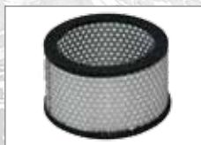
535.450 Filterpatrone HEPA