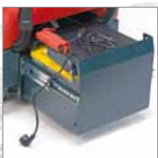
Ladestecker zum Aufladen der Batterien