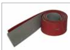
535.083 Abstreiflamellensatz linatex (Fliesenböden)