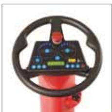
Bedienpanel mit Ladekontrollanzeige