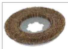
535.0595K 5K-Bürste (Supermarket Mix)