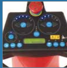
Chemiedosierung auf Bedienpanel einstellbar