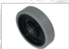
535.240 Antriebsrad „Supergrip“