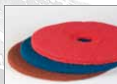
535.910.5 Pad rot (5 Stück) 535.911.5 Pad blau (5 Stück) 535.912.5 Pad braun (5 Stück)