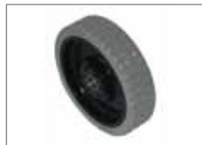
535.230 Antriebsrad Standard