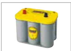
436.091 Spiral Cell Batterien