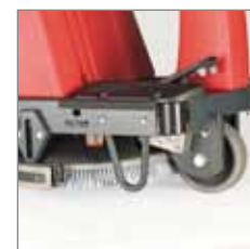
Saugfuss direkt hinter der Bürste eingebaut