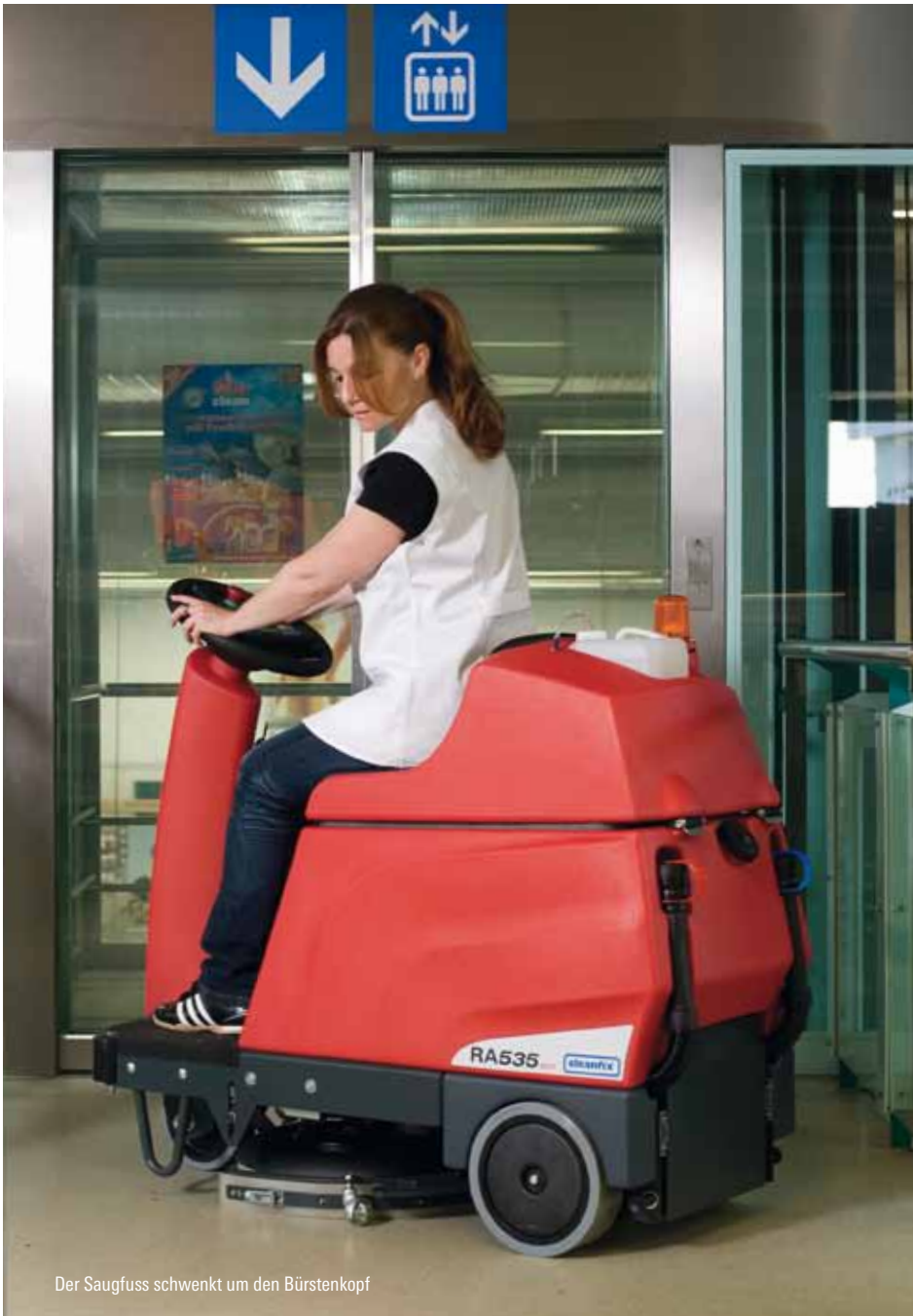
Der Saugfuss schwenkt um den Bürstenkopf

Enger Kurven-Radius, schmale Türen, schmale Gänge – ein Leichtes für die Aufsitz-Scheuersaugmaschine, die mit einem Knopfdruck in Betrieb gesetzt wird.