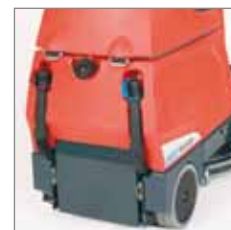
Hinteransicht mit Frisch- und Schmutzwassertank-Entleerung