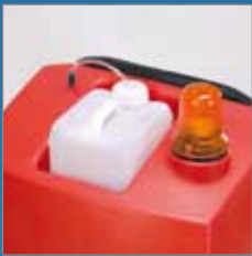
Chemiekanister für die Dosierung