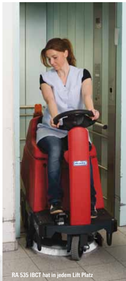
RA 535 IBCT hat in jedem Lift Platz