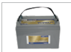
436.093 AGM Batterien