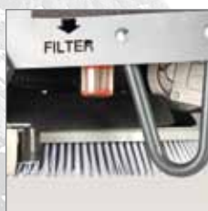
Filter und Sicherheitsbügel