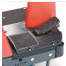
Fussauflage antirutsch beschichtet