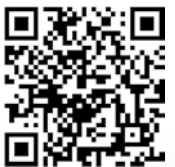
Video RA 535 IBCT