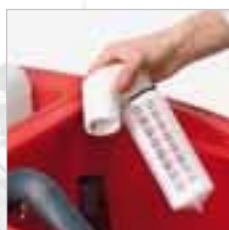
RA 505 IBC / RA 505 IBCT / RA 605 IBCT Der Schwimmer mit Filter kann herausgenommen und gereinigt werden. Er dient gleichzeitig als Überlaufschutz.