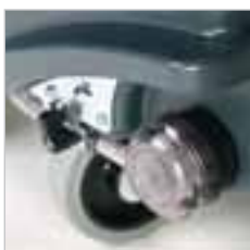
RA 505 IBC Frischwasser-Filter einfach zugänglich und Wasserregulierung stufenlos verstellbar.