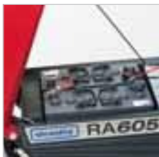
RA 505 IBCT / RA 605 IBCT Einfacher Zugang zu Batterien. Einzelne Sicherungen für Saug- und Bürstmotor sowie Antrieb.