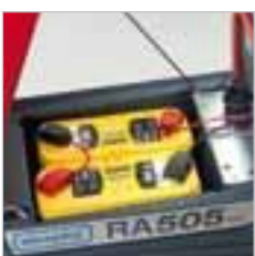
RA 505 IBC Einfacher Zugang zu Batterien. Einzelne Sicherungen für Saug- und Bürstmotor.