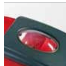
RA 505 IBC / RA 505 IBCT / RA 605 IBCT Durch das Schauglas behält der Bediener immer die Übersicht über das Geschehen.