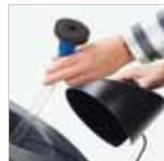
RA 505 IBC / RA 505 IBCT / RA 605 IBCT Optionaler Einfüllschlauch lässt sich immer mitführen. Der Frischwassertank kann so an jedem Wasserhahn aufgefüllt werden.