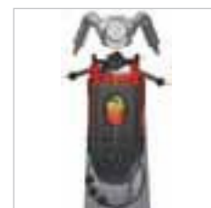
RA 505 IBC / RA 505 IBCT / RA 605 IBCT Die abgerundete Form ermöglicht ein vorausschauendes Arbeiten. Der Blick zur Bürste vorne rechts ist frei.