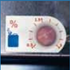
Option: Chemiedosierung einfach einzustellen.