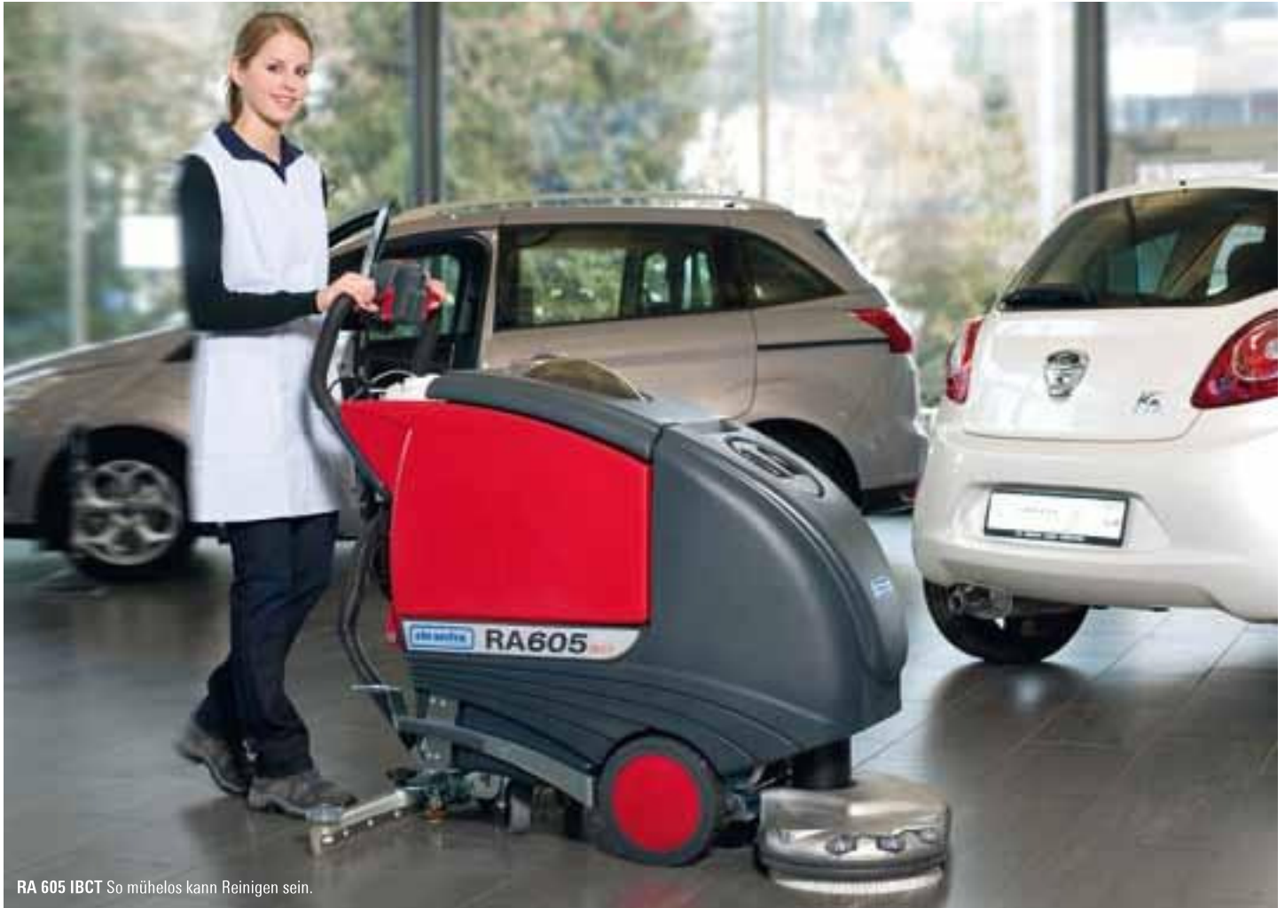
RA 605 IBCT So mühelos kann Reinigen sein.