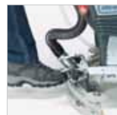
RA 505 IBC / RA 505 IBCT / RA 605 IBCT Saugfuss einfach zu bedienen.