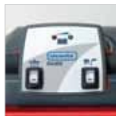
RA 505 IBC Dieses Bedienpanel lässt keine Fragen offen.