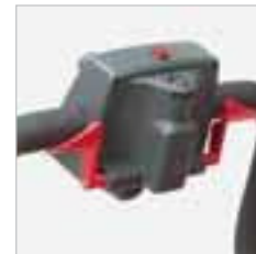
RA 505 IBC / RA 505 IBCT / RA 605 IBCT Der Sicherheitshebel sorgt dafür, dass die Maschine ohne Bediener nicht funktioniert. Bei der RA 505 IBCT und RA 605 IBCT wird durch den Hebel die Geschwindigkeit feinreguliert.