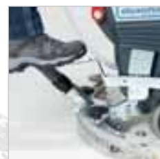
RA 505 IBC / RA 505 IBCT / RA 605 IBCT Bürstenabhebung und Saugdüse einfach mit dem Fuss zu bedienen.