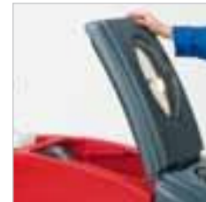
RA 505 IBC / RA 505 IBCT / RA 605 IBCT Durch die grosse Öffnung ist die Maschine einfach zu Öffnen und zu Reinigen.