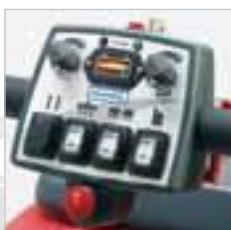
RA 505 IBCT / RA 605 IBCT Übersichtlich gestaltetes Bedienpanel.