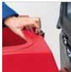
RA 505 IBC / RA 505 IBCT / RA 605 IBCT Maschinen sind leicht zu öffnen, das Batteriefach ist einfach zu erreichen.