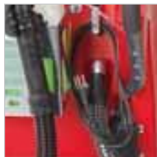
RA 505 IBC / RA 505 IBCT / RA 605 IBCT Nach getaner Arbeit einfach das Kabel abrollen und einstecken, schon lädt das integrierte Ladegerät auf. Das Ladegerät befindet sich vor Nässe geschützt im Innern der Maschinen.