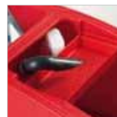
RA 505 IBC / RA 505 IBCT / RA 605 IBCT Der Grobschmutzfilter fängt alle groben Verschmutzungen auf. Einfach zu entleeren und reinigen.