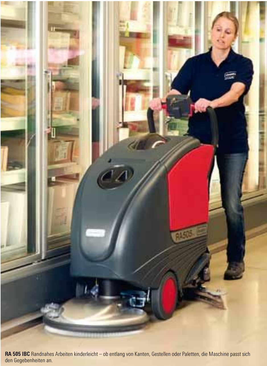
RA 505 IBC Randnahes Arbeiten kinderleicht – ob entlang von Kanten, Gestellen oder Paletten, die Maschine passt sich den Gegebenheiten an.