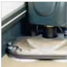
RA 605 IBCT Bürstenkopf leicht seitlich vorstehend, somit ist eine Reinigung unter Gestellen möglich. Unterfahrhöhe: < 10 cm