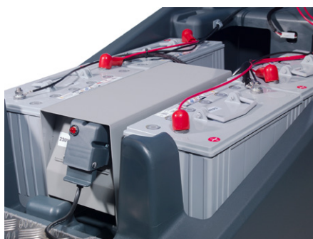
Einfacher Zugang zur Technik

TRG720/200T mit 2x Padloc-Treibtellern Art.-Nr.: 166022V