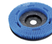
weich 15" Art.-Nr. 210.429

Für verschiedene Untergründe stehen Bürsten in verschiedenen Härtegraden zur Verfügung.