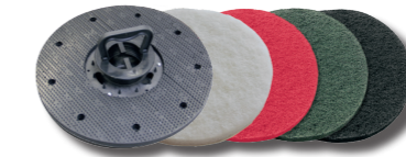
Pad-Treibteller und Pads in verschiedenen Härtegraden.