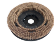
Rosshaar 15" Art.-Nr. 210.430

Tipp Die Rosshaar-Bürste eignet sich hervorragend für Feinsteinzeug und Sicherheitsfliesen.