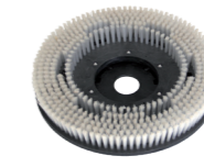
mittel 15" (Standard) Art.-Nr. 210.427