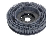
abrasiv 15" Art.-Nr. 210.428