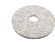
Duo Pad Art.-Nr. 210.243