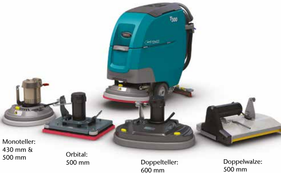
Monoteller: 430 mm & 500 mm

Die T300 Scheuersaugmaschine gibt es mit unterschiedlichen Typen von Schrubbköpfen, die auf Ihre Reinigungsanforderungen zugeschnitten sind und die Reinigungsleistung optimieren.