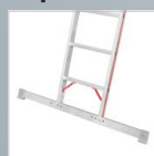
Traverse für Leiterteil