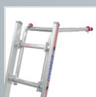
Wandabstandshalter für Sprossenleitern