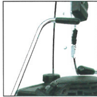
Schwenken der Kkehrbürste in 5 Positionen