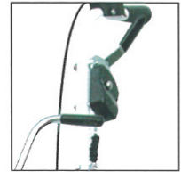
Verstellung der Fahrgeschwindigkeit von 2,4 - 4,8 km/h (bei Limpar 102/122)