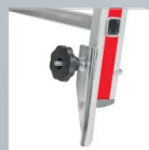
Fußspitzenset für Holme › Siehe Seite 174.