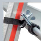
Leiterhaltersset für Dachrinnen › Siehe Seite 178.