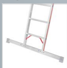
Traverse für Leiterteil › Siehe Seite 176.