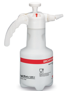
Food-Matic 1.25 P mit Regulierdüse Art.Nr. 11990801