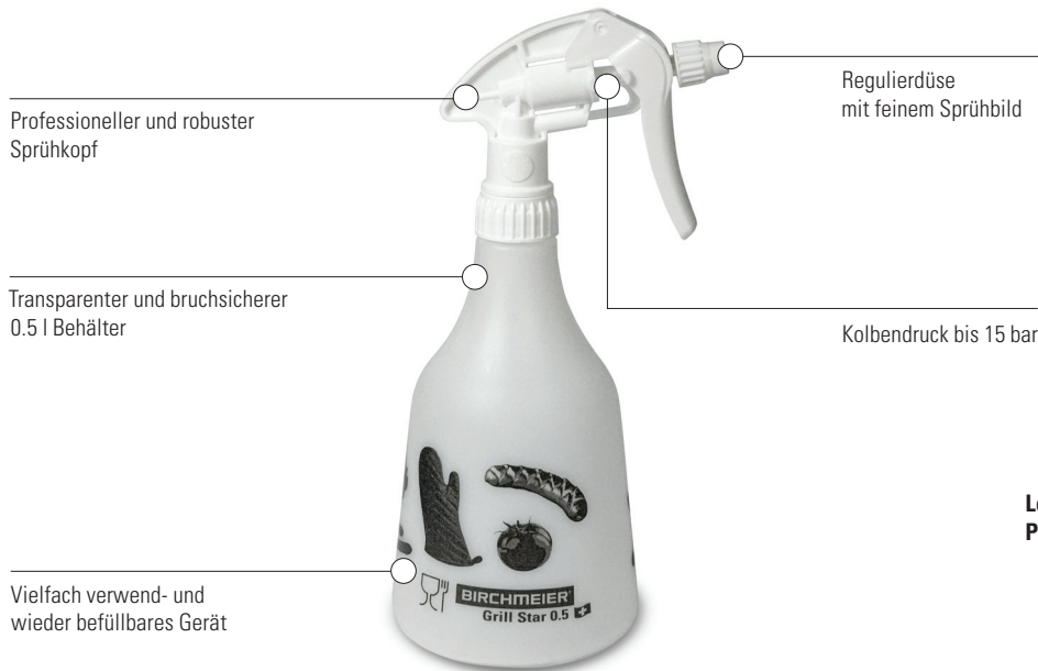
Grill Star 0.5 Art.Nr. 12086501