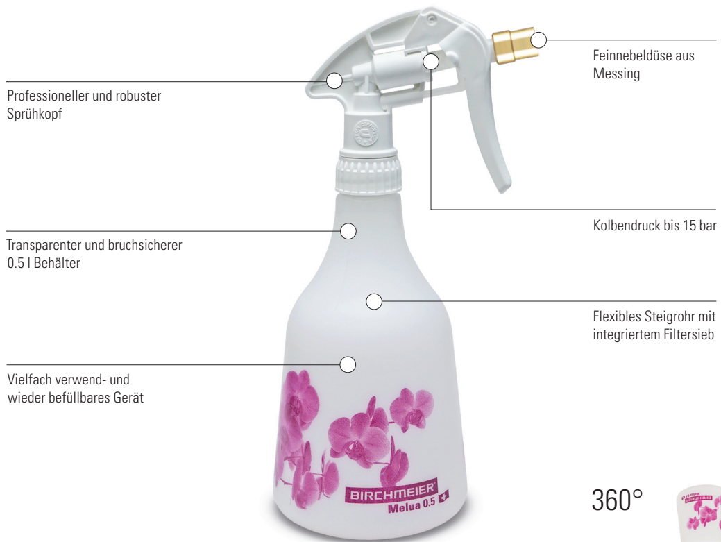
Melua 0.5 / 360° Art.Nr. 11863601