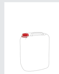
Kanister 10 l Art.-Nr.: 2001472