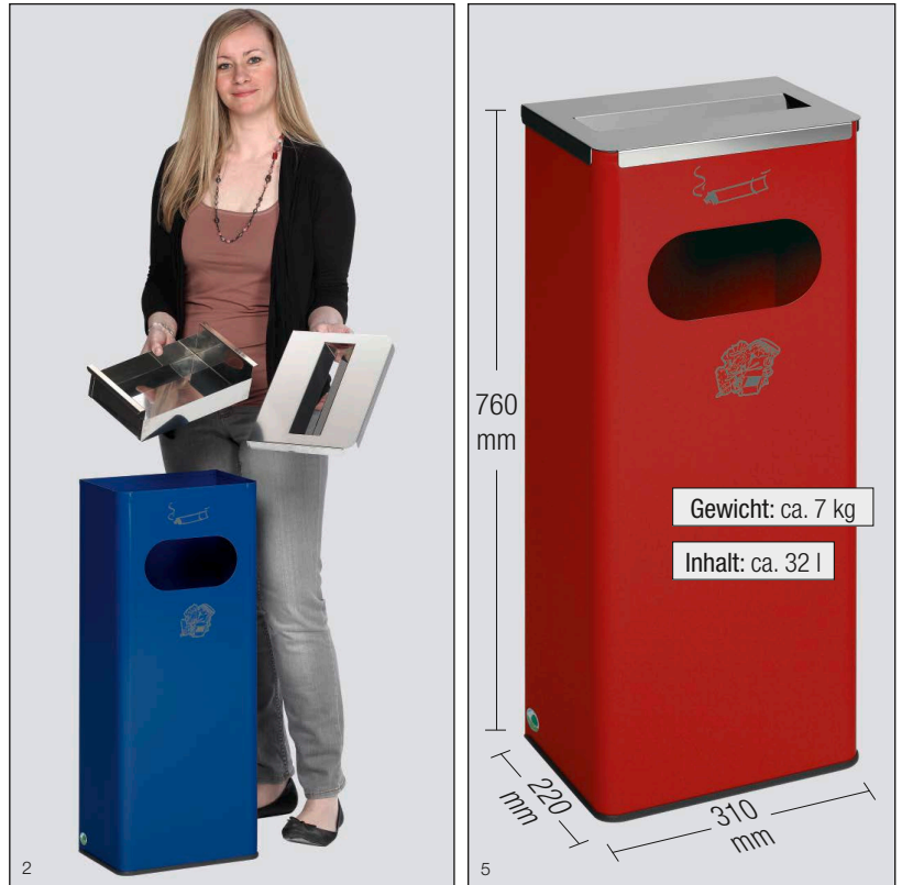
Abb.: Art.-Nr. 28732