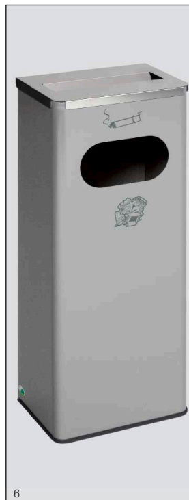
Abb.: Art.-Nr. 28733