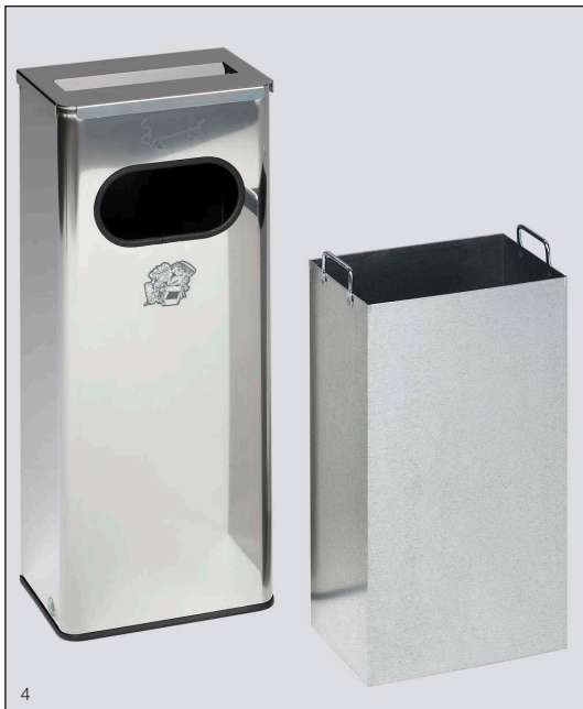
Abb.: Art.-Nr. 28738 und 28739