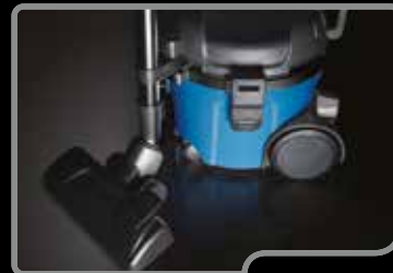
Der Saugschlauch kann am Staubsauger eingehakt werden. Eine nützliche Vorrichtung beim Verstauen des Geräts