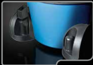
Mit praktischem Zubehörhalter, um alles Nötige stets griffbereit zu haben