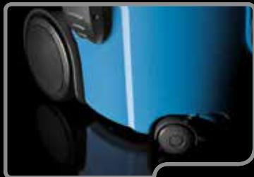
Die großen Hinterräder und die beiden vorderen Schwenkräder garantieren Stabilität und Handlichkeit

NANO ist ein kompakter, leichter Staubsauger, das perfekte Gerät für kleine gewerbliche Bereiche, weil er praktisch in der Verwendung und beim Tragen ist. Er ist mit einem leistungsstarken 1200 W Motor für gewerbliche Verwendung ausgestattet. Ideal für die tägliche Reinigung von Geschäften, Hotelzimmern, Büros und kleinen bis mittelgroßen Flächen.