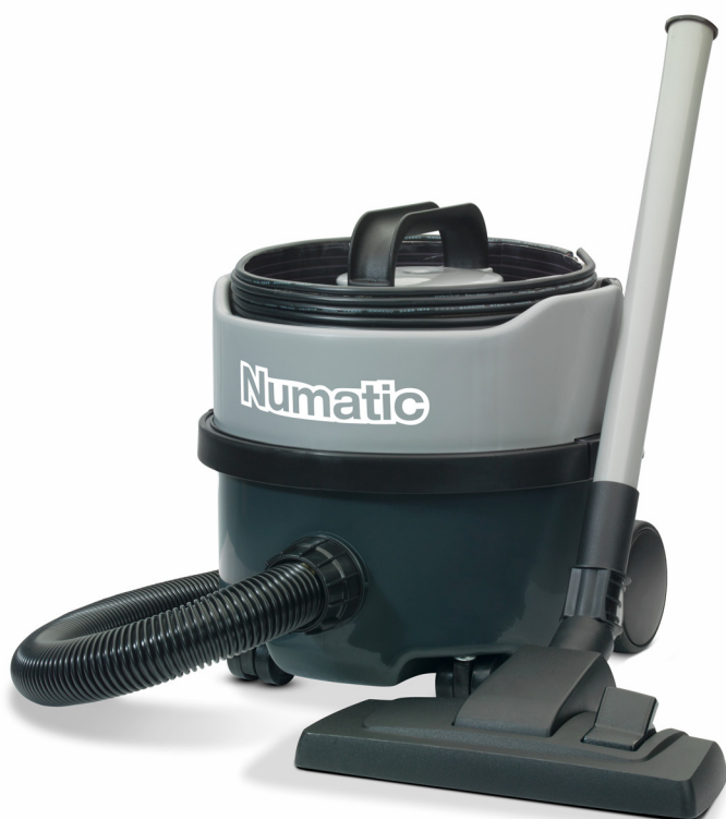
Inklusive Zubehörset NA1 32 mm:

Kompakter Profi-Staubsauger für die tägliche Unterhaltsreinigung. Das Gerät ist mit einem sehr leistungsstarken und langlebigen Hochleistungsmotor (Ametek/Lamb) ausgestattet. Die Energieaufnahme beträgt bei diesem leistungsstarken Gerät 620 Watt und entspricht somit der Energieeffizienzklasse A. Das Gerätekabel mit Schnellwechselsystem kann einfach in der Motorkopfablage verstaut werden. Zur leichten und platzsparenden Aufbewahrung des Saugrohrs und der Bodendüse ist das Gerät mit einer Parkfunktion ausgestattet. Im Lieferumfang enthalten ist ein professionelles Zubehörset mit leichten und stabilen Alu-Saugrohren, trittfestem Saugschlauch, robuster HiPro-Kombidüse und Kleinteile-Zubehör.