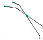
Scheren-Stiel mit Verstärkung